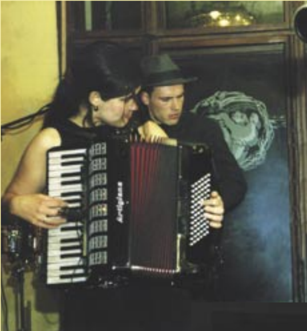
Di grine Kuzine

Das „Garbáty“ in der denkmal - geschützten kleinen Villa mit dem einladenden, „Pankow-typischen“ Vorgarten überrascht vor allem Nicht-Berliner. Auffallend die im Jugendstil gehaltene Innenausstattung, besonders die Fenstergestaltung des Pankower Glas-Künstlers Harald Floren.