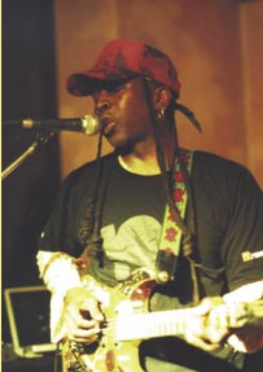
Vernon Reid am 27.02.2006